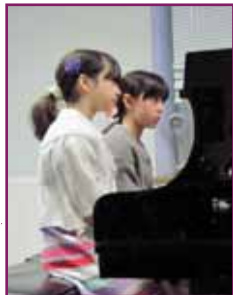
Carte blanche février 2011

Les inscriptions sont possibles également en cours d'année en fonction des places disponibles.