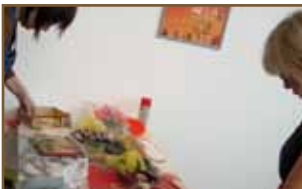
Atelier création Christophe Durbec