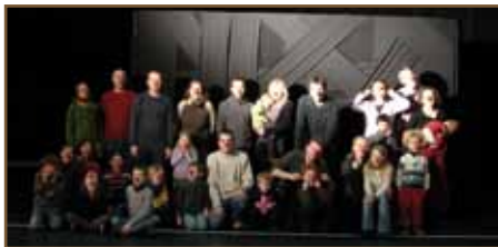
Atelier clown parents/enfants janvier 2011.

Partager un temps de découverte et d'initiation ludique aux jeux du cirque entre petits et grands !