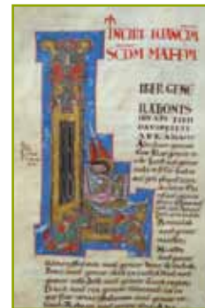
La Bible de Saint-Yrieix

Aujourd'hui elle est conservée dans la chambre forte de la bibliothèque, visible par tous.