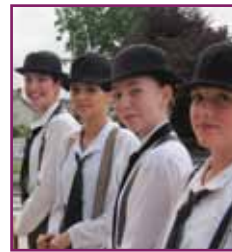
Gala de danse 2011

Elle prend notamment en charge, pour ses adhérents, le prix d'entrée de certains spectacles au centre culturel.