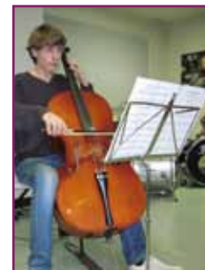
Carte blanche mars 2011