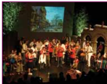
Spectacle Amérique latine centre culturel juin 2011