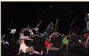
Stage danse Cie Alexandra N'Possee