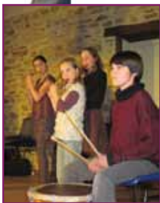
Bal trad' Glandon mars 2011

Envie d'apprendre à jouer d'un instrument de musique ou de pratiquer la danse?