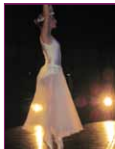
Gala de danse 2011

Vedrenne Cécile : flûte traversière formation musicale et direction d'ensembles