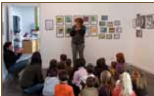
Rencontre classe de Lamouille exposition Nicolas Gouny