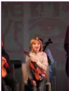
CDLA octobre 2010